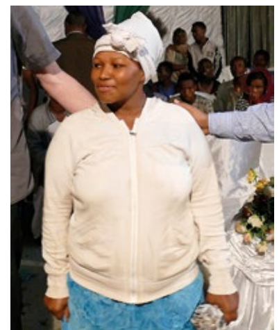
Sie wurde von einem bösen Geist befreit.