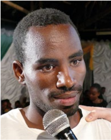
Wegen starker Kopfschmerzen konnte er die letzten 2 Wochen nicht arbeiten. Geheilt.