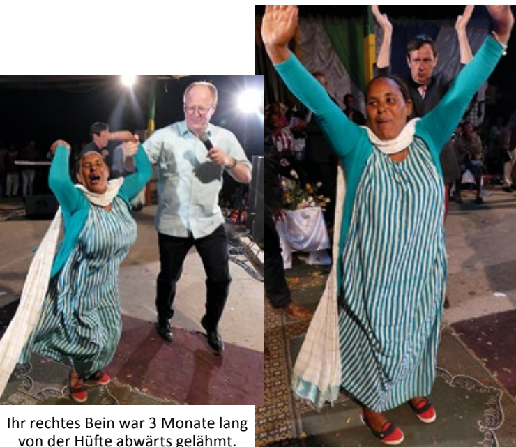
Ihr rechtes Bein war 3 Monate lang von der Hüfte abwärts gelähmt. Sie reiste 750 km um ihre Heilung zu empfangen.