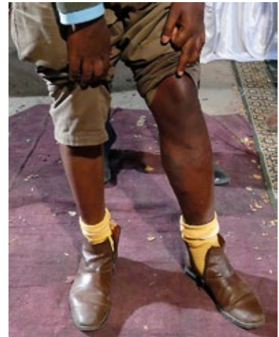
20 Jahre lang hatte er ein schmerzhaftes, geschwollenes Bein. Er konnte nur unter Schmerzen auftreten. Die Schmerzen sind weg und er kann wieder normal gehen.