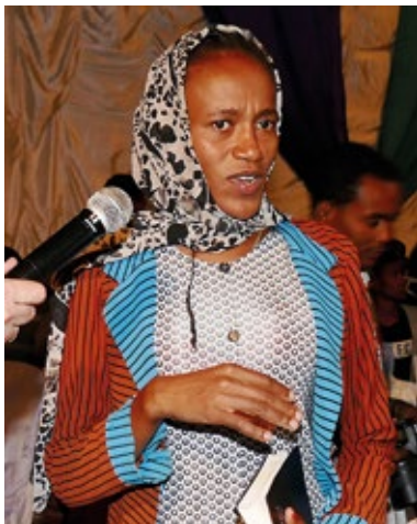
Seit 12 Jahren litt sie an Schulter- und Rückenschmerzen. Das Gehen bereitete ihr Probleme. Alle Schmerzen sind verschwunden.