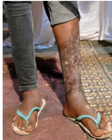
Er hatte Hautkrebs und starke Schmerzen in seinem Bein, so dass er nicht auftreten konnte. Alle Schmerzen sind weg und er kann wieder normal gehen.